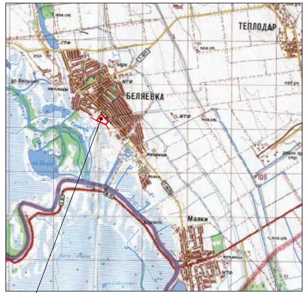
Схема розташування житлового кварталу у планувальній структурі міста Біляївка

Фрагмент карти загального сейсмічного районування території України ЗСР-2004-А. Одеська обл. Рис. Б.5 ДБН В.1.1-12:2014