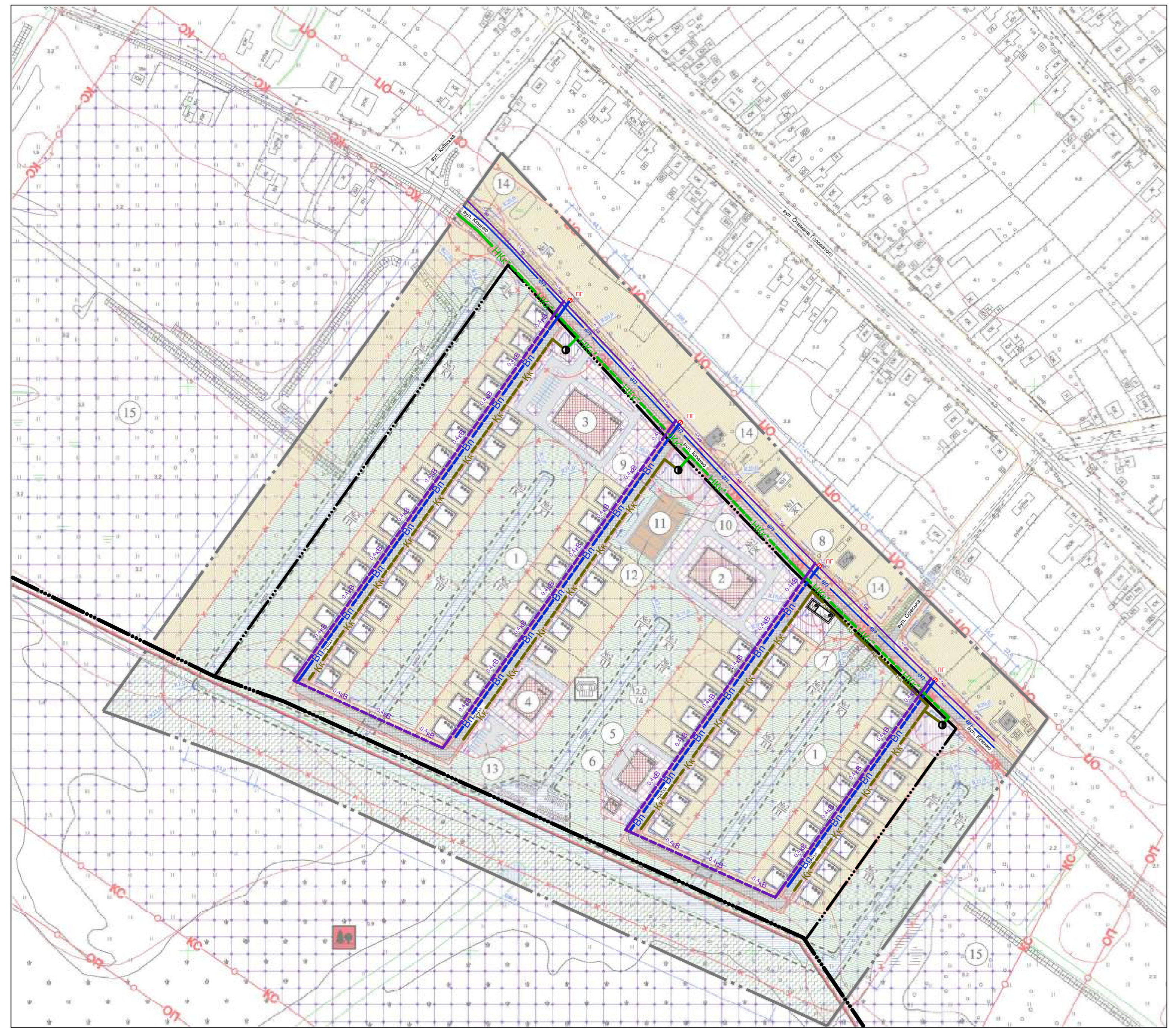
Схема інженерних мереж, споруд і використання підземного простору М1:2000