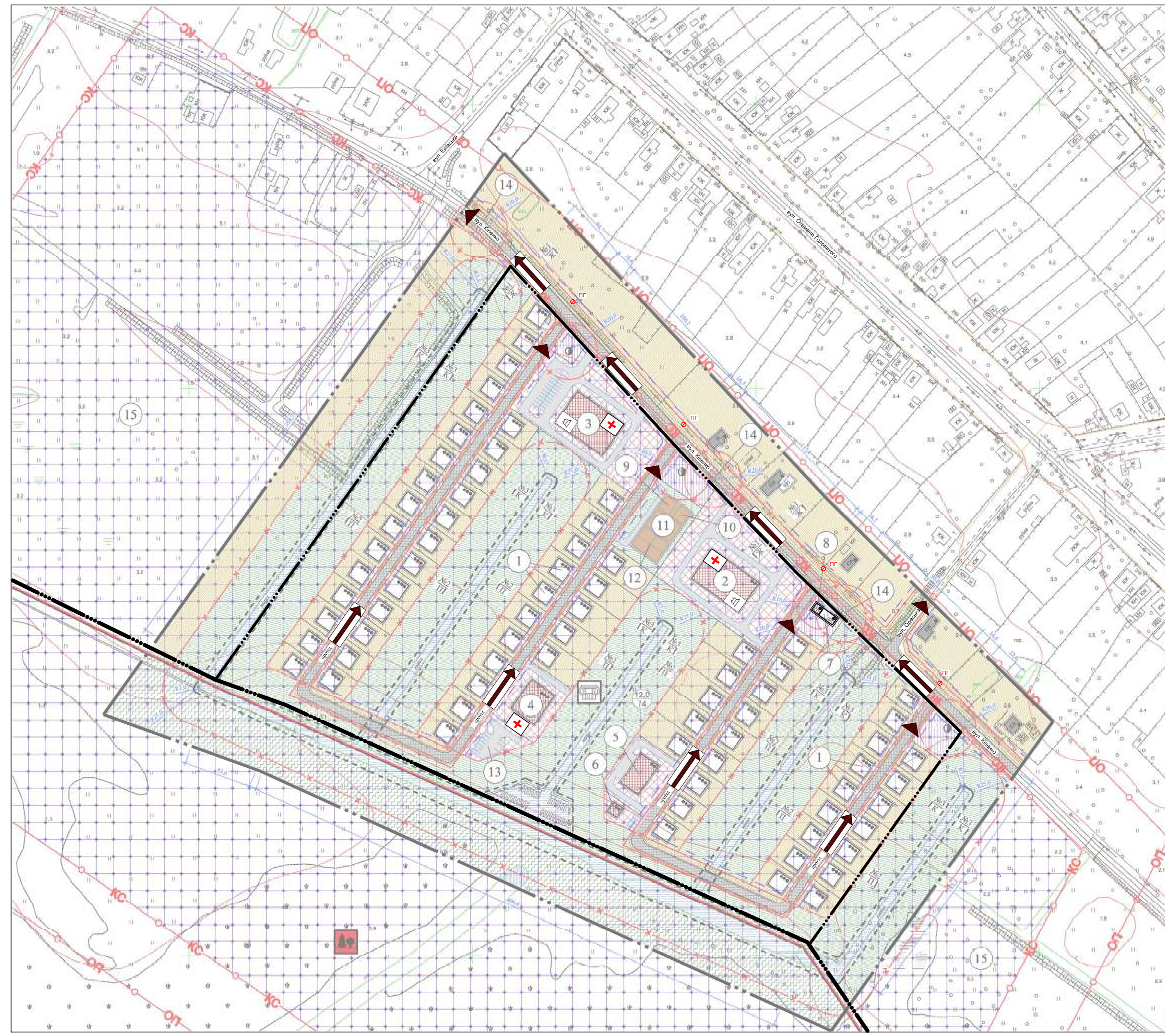
Схема інженерно-технічних заходів цивільного захисту (цивільної оборони) М1:2000