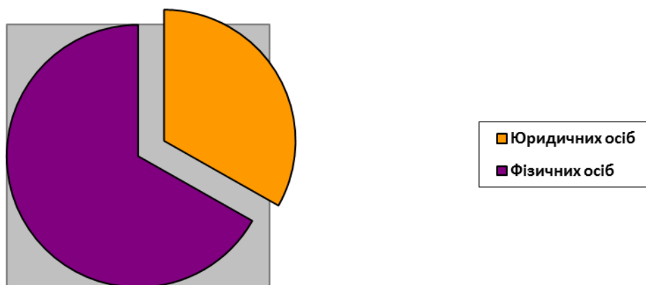
Діаграма.2 Кількість юридичних та фізичних осіб-підприємців на території Біляївської ОТГ

Кількість фізичних осіб підприємців, зареєстрованих на території громади станом на 01.01.2019 року складає 869.