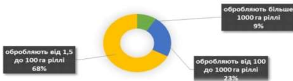
Діаграма 2. Класифікація сільськогосподарських підприємств за площею

Найбільш ефективними та конкурентоспроможними є фермерські господарства, їх діяльність ґрунтується на принципах підприємницької діяльності, що визначає активну позицію у формуванні ринку сільськогосподарської продукції громади. Частка таких підприємств становить 68%, що в розрахунку на 1 підприємство обробляють в середньому 35 га.