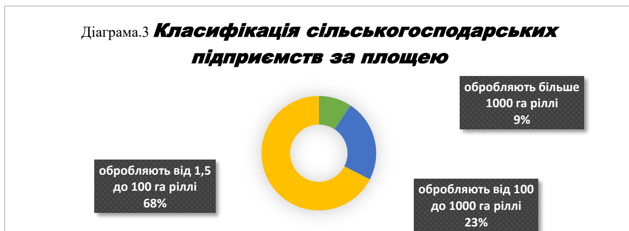
Діаграма.3 Класифікація сільськогосподарських підприємств за площею

Найбільш ефективними та конкурентоспроможними є фермерські господарства, їх діяльність ґрунтується на принципах підприємницької діяльності, що визначає активну позицію у формуванні ринку сільськогосподарської продукції громади. Частка таких підприємств становить 68%, що в розрахунку на 1 підприємство обробляють в середньому 35 га.