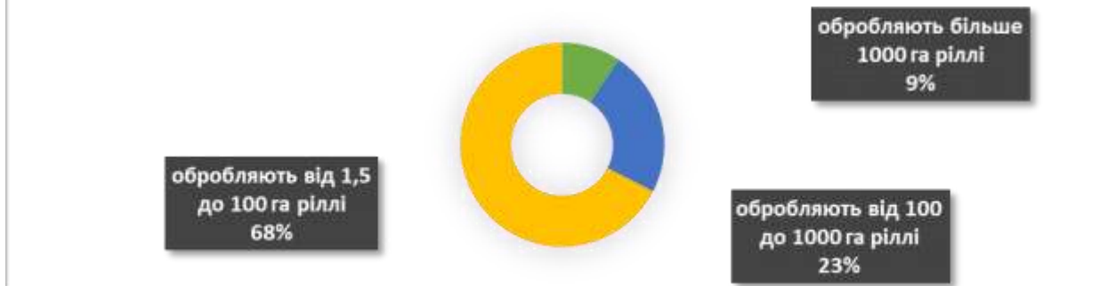
Діаграма.2 Класифікація сільськогосподарських підприємств за площею

Найбільш ефективними та конкурентоспроможними є фермерські господарства, їх діяльність ґрунтується на принципах підприємницької діяльності, що визначає активну позицію у формуванні ринку сільськогосподарської продукції громади. Частка таких підприємств становить 68%, що в розрахунку на 1 підприємство обробляють в середньому 35 га.