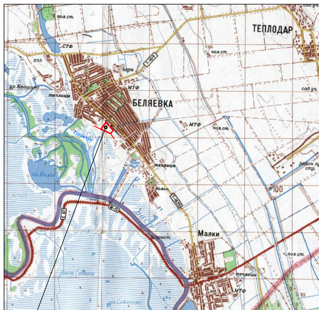
Схема розташування житлового кварталу у планувальній структурі міста Біляївка