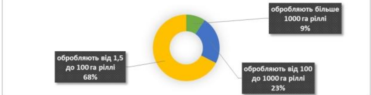
Діаграма.3 Класифікація сільськогосподарських підприємств за площею

Найбільш ефективними та конкурентоспроможними є фермерські господарства, їх діяльність ґрунтується на принципах підприємницької діяльності, що визначає активну позицію у формуванні ринку сільськогосподарської продукції громади. Частка таких підприємств становить 68%, що в розрахунку на 1 підприємство обробляють в середньому 35 га.