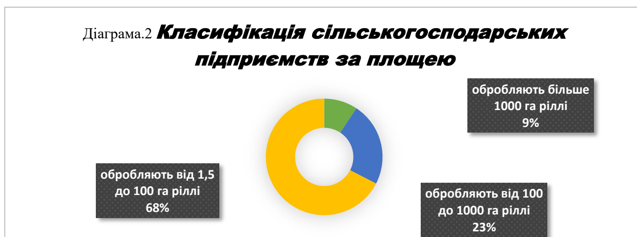
Діаграма.2 Класифікація сільськогосподарських підприємств за площею

Найбільш ефективними та конкурентоспроможними є фермерські господарства, їх діяльність ґрунтується на принципах підприємницької діяльності, що визначає активну позицію у формуванні ринку сільськогосподарської продукції громади. Частка таких підприємств становить 68%, що в розрахунку на 1 підприємство обробляють в середньому 35 га.